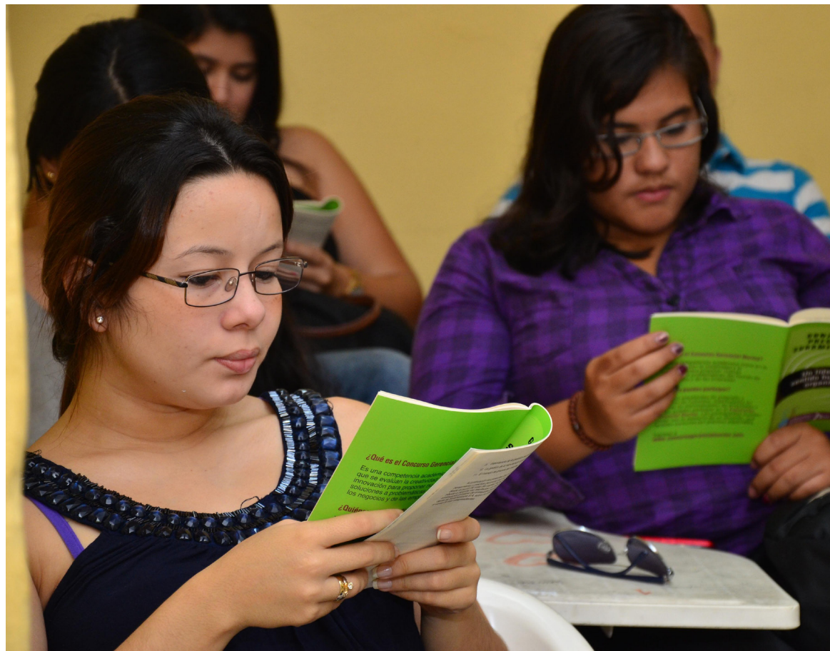
Los estudiantes perciben el trabajo que realiza la Universidad en su proceso de acreditación.

Para este logro, el Comité de Comunicaciones de esta institución se prepara para el lanzamiento de la campaña institucional que permita sensibilizar a todos los actores sobre la importancia de la acreditación y que será acogida con acciones pertinentes por los programas académicos que están en el proceso.