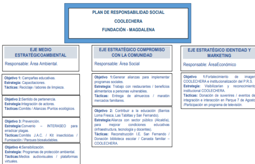
Figura 2. Plan de Responsabilidad Social Coolechera (Fundación, Magdalena)