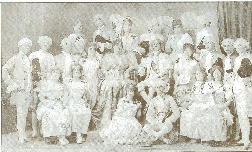
Baile en el Club Barranquilla el 18 de febrero de 1917