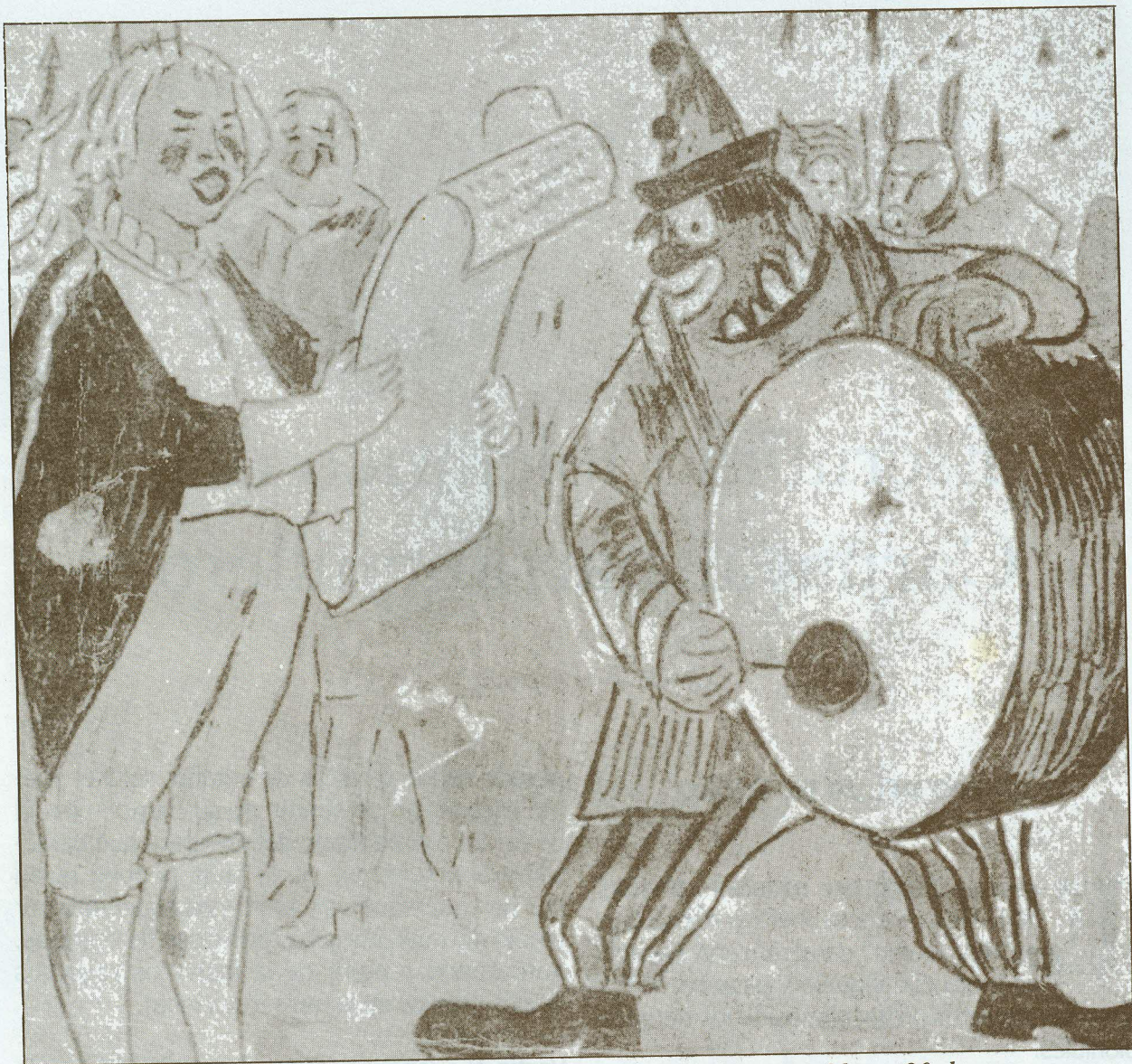
Dibujo alusivo a la tradicional Lectura del Bando, instituido un 20 de enero.

Los restantes —caporales de las danzas y las cofradías— Toritos, Congos, Garabatos, Goleros, Congos, Caimanes, Tigres, Pájaros, Pilanderas, Gavilanes, Micos, Indios chimilas, Diablitos, espejos, Paloteos, entre otros, vestían clásicos atuendos, máscaras totémicas, caretas y capuchones, marimondas y monocucos guayaberos, todos a cuál más dicharacheros, pues la razón de esta festividad lisonjera, frívola, afán de hacer reír para sacarle partido al ridículo sin hacerlo.