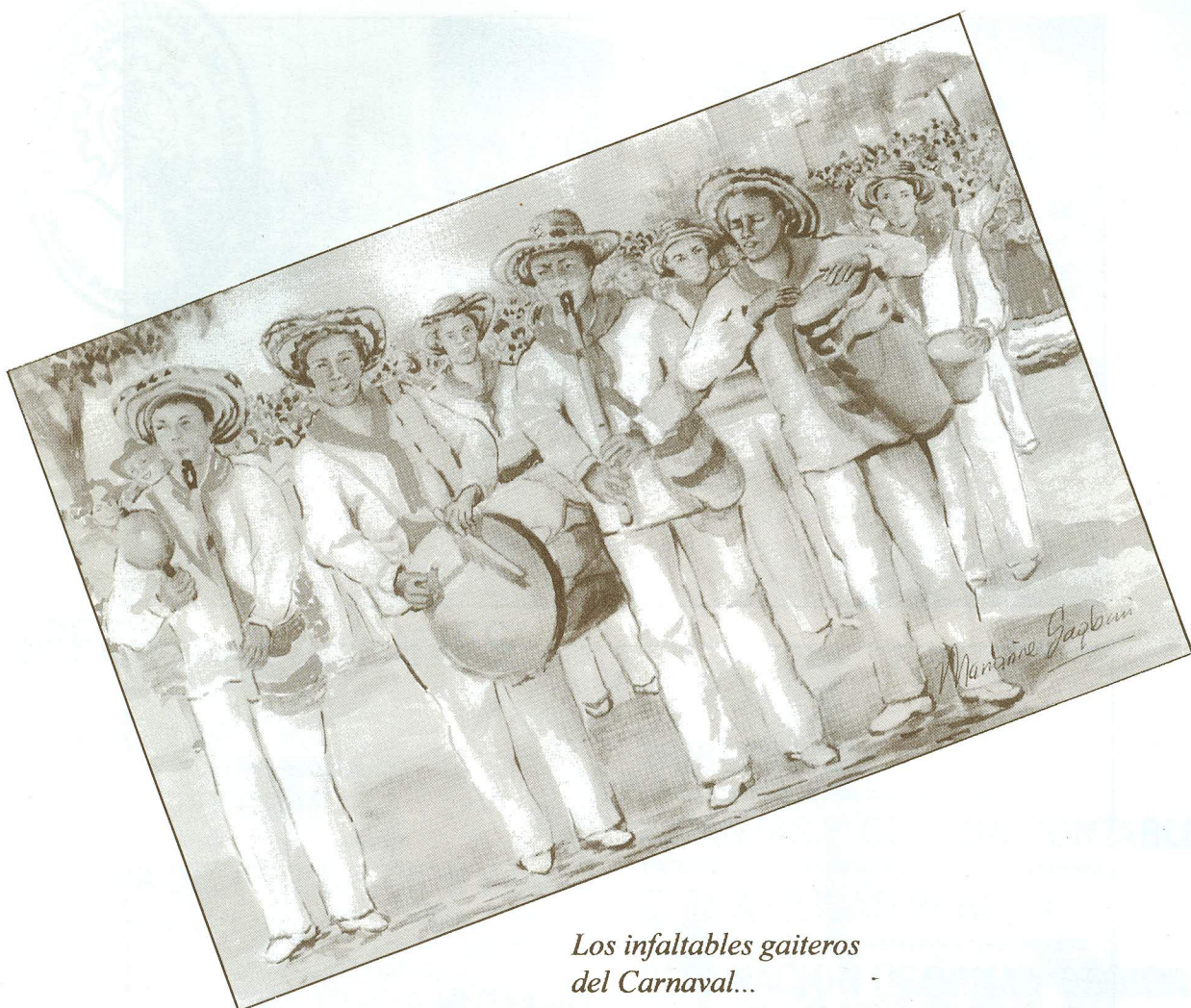
Los infaltables gaiteros del Carnaval...