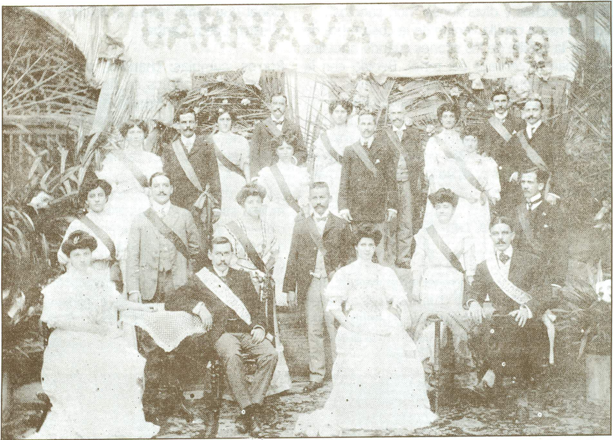
Carnaval de 1908

neral Heriberto Vengoechea, cuando a partir de aquel año, hasta siempre, este desfile constituye uno de los espectáculos más bellos de la fiesta vernácula, el sábado en horas de la tarde.