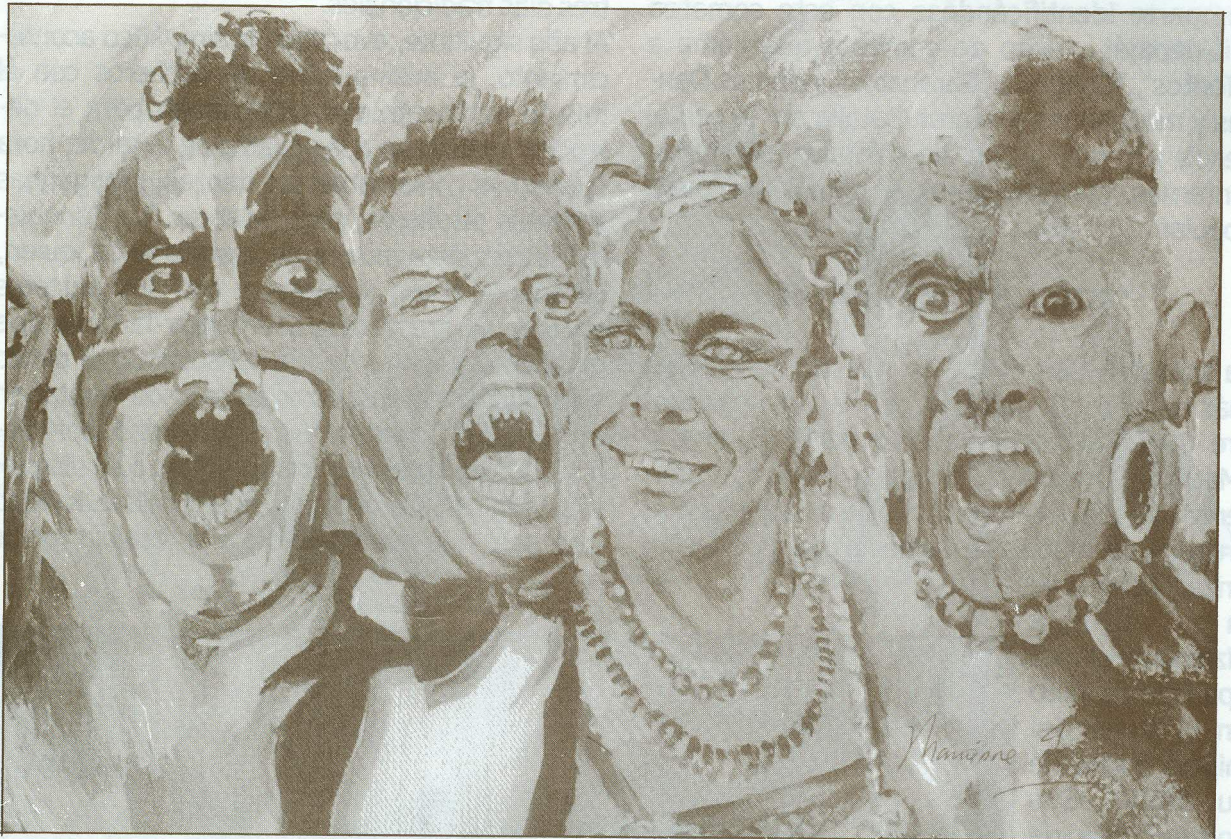
Disfraces tradicionales: Negros, dráculas y María Moñito