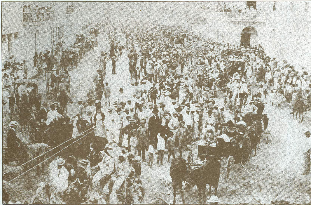
Sábado de Batalla de Flores en 1903, al fondo, el Club Barranquilla