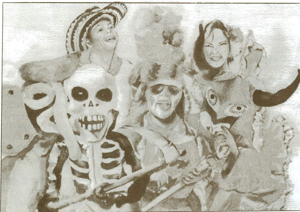
Difrances típicos: Congo, Marimonda y Danza del Torito

Festividades lo incorporó al programa recuperándose así esa vieja tradición. Pero, ahora, con un sentido más espectacular, concentrando las danzas, agrupaciones folclóricas y demás carnavaleros, en un regio desfile incluyendo carrozas, camiones, farolas, terminando en el Barrio Abajo, sector popular que en aquellos viejos tiempos gozó de mucho prestigio por las guachernas de su barrio.