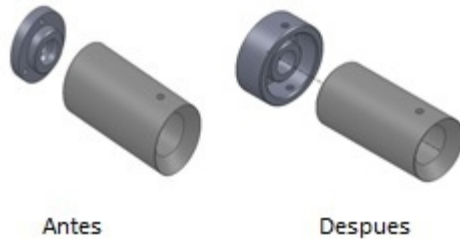
Figura 1. Cambio al cilindro de extrusión

Cambio de los empaques del cilindro neumático y engrase del mismo (figura 2), ya que por la falta de uso se encontraban cristalizados y severamente dañados por lo cual se dispuso el remplazo de todos los empaques ya que el escape de aire era permisible impidiendo que el cilindro neumático ejecutara su función a cabalidad.