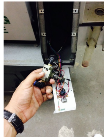
Figura 4. Reparación de las válvulas del centro de termoformado.

Reparación de las válvulas que potencian el cilindro neumático, las válvulas presentaban problemas en el cableado (figura 4), mala conexión de los tubos de conducción de aire, mala graduación y bloqueo en las vías de conducción de aire.