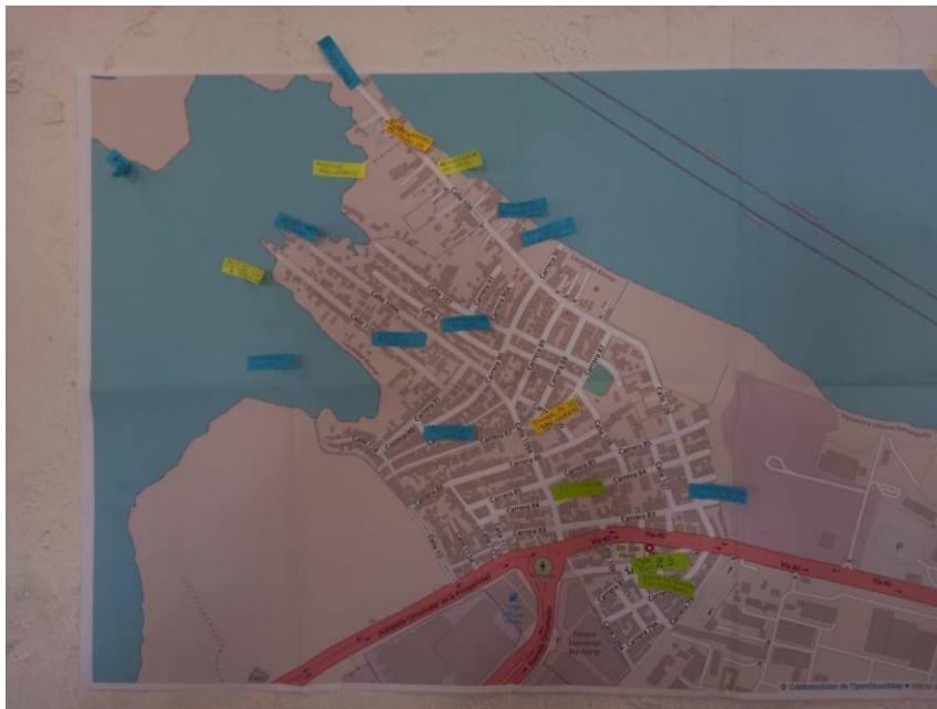
Mapa de atractivos

En la Figura 5, presentamos un mapa impreso en el cual los participantes identificaron geográficamente puntos de interés para posibles visitantes. Se tuvieron en cuenta factores como casas de artesanos, parques, sitios con representación histórica o cultural, entre otros.