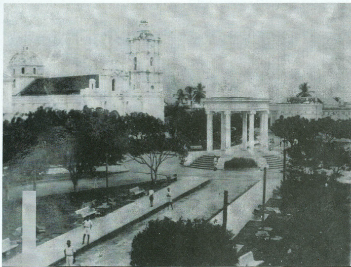
Parque del Centenario de Ciénaga.