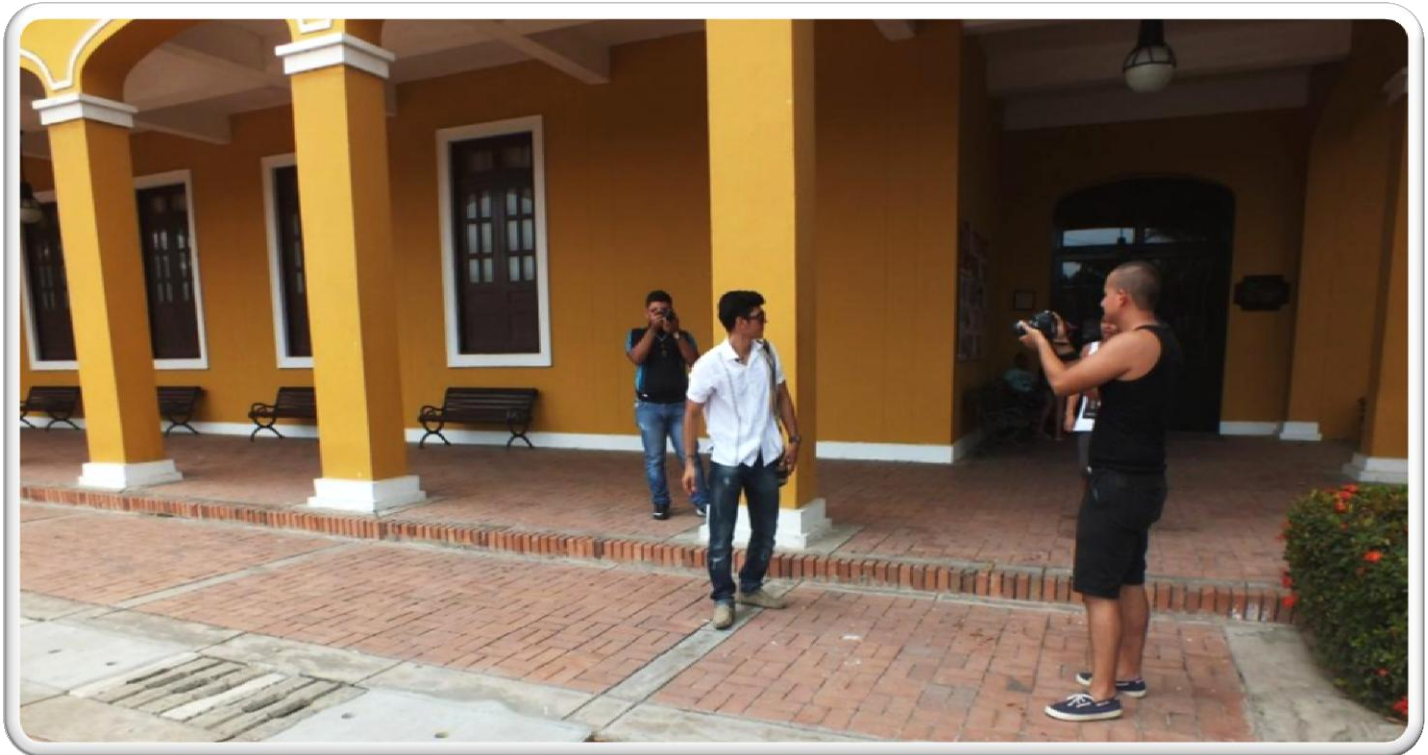
TOMADO POR: GABRIEL URREGO ADUANA, BARRANQUIILA COLOMBIA ESCENARIO DOCUMENTAL RÍO Y CIUDAD