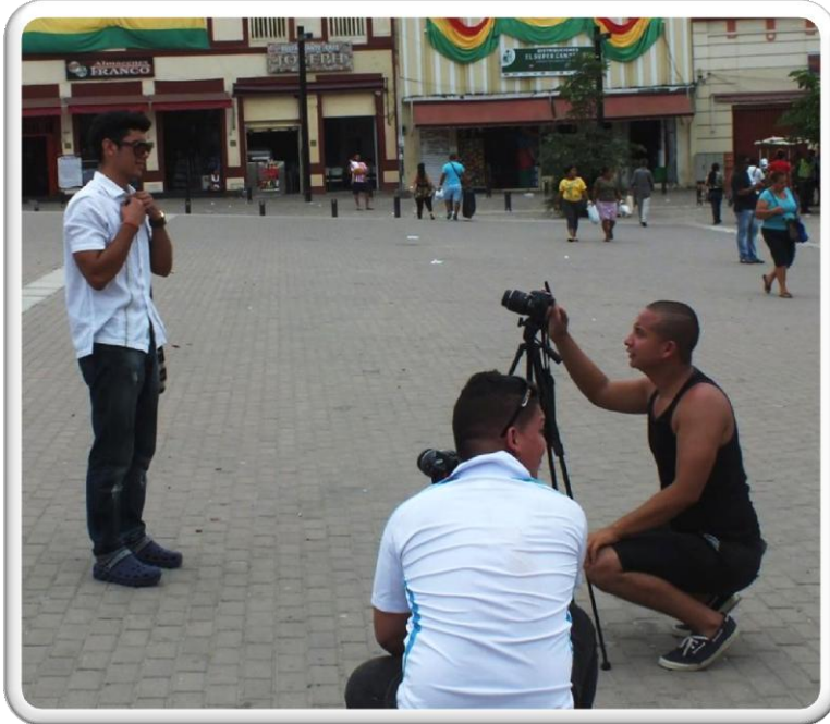
PLAZA SAN NICOLAS, BARRANQUIILA COLOMBIA ESCENARIO DOCUMENTAL RÍO Y CIUDAD