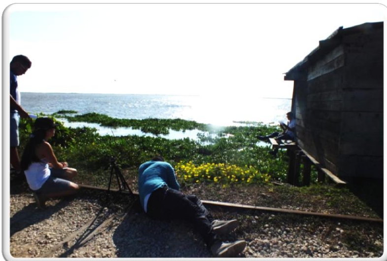
BOCAS DE CENIZA, BARRANQUILLA COLOMBIA ESCENARIO DOCUMENTAL RÍO Y CIUDAD