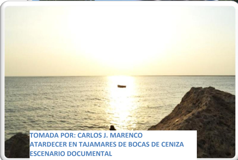
ATARDECER EN TAJAMARES DE BOCAS DE CENIZA ESCENARIO DOCUMENTAL