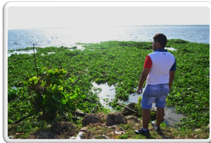
TOMADA POR: ROBERTO PAUTT HABITANTE DE TAJAMARES DE BOCAS DE CENIZA ESCENARIO DOCUMENTAL