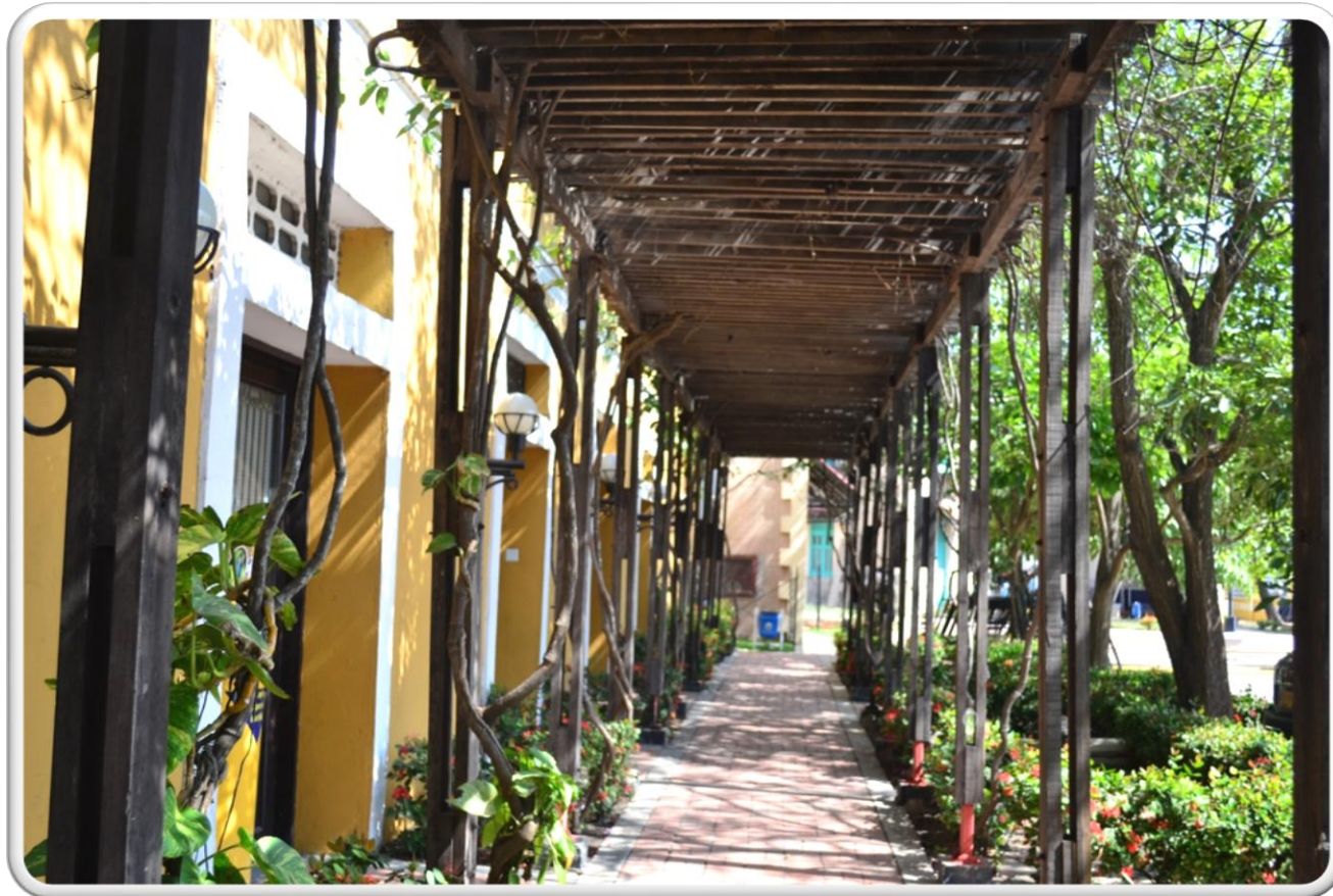
PASILLO DE LA BIBLIOTECA PILOTO DEL CARIBE LA ADUANA ESCENARIO DOCUMENTAL