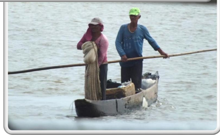
AVENIDA DEL RÍO ESCENARIO DOCUMENTAL