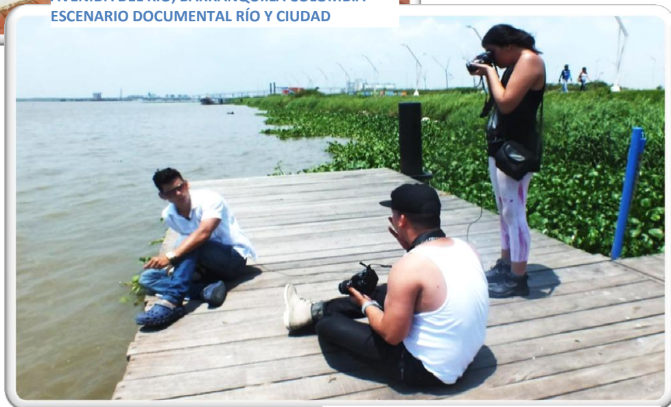
AVENIDA DEL RÍO, BARRANQUILLA COLOMBIA ESCENARIO DOCUMENTAL RÍO Y CIUDAD