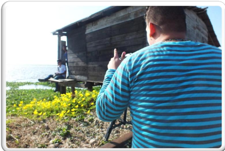
BOCAS DE CENIZA, BARRANQUILLA COLOMBIA ESCENARIO DOCUMENTAL RÍO Y CIUDAD