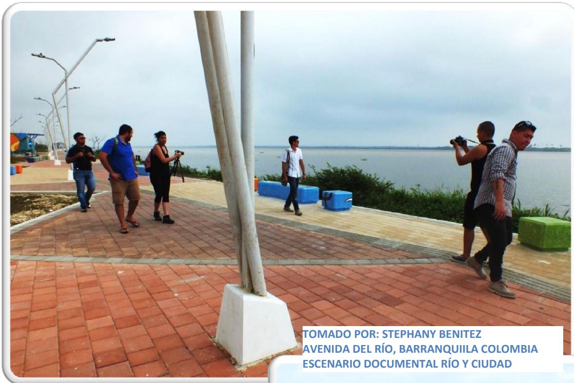
AVENIDA DEL RÍO, BARRANQUILLA COLOMBIA ESCENARIO DOCUMENTAL RÍO Y CIUDAD