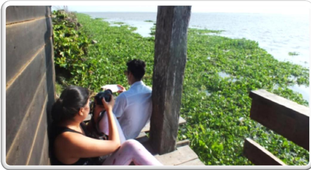
BOCAS DE CENIZA, BARRANQUILLA COLOMBIA ESCENARIO DOCUMENTAL RÍO Y CIUDAD