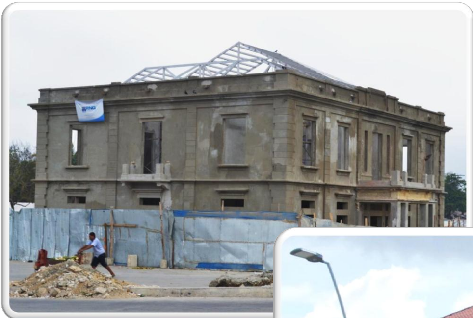
ANTES INTENDENCIA FLUVIAL