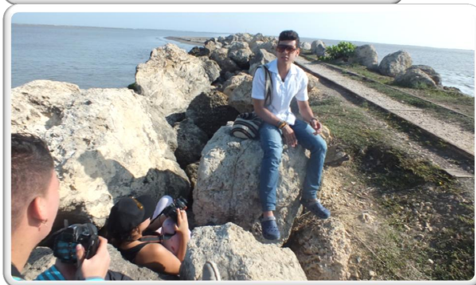
BOCAS DE CENIZA, BARRANQUILLA COLOMBIA ESCENARIO DOCUMENTAL RÍO Y CIUDAD