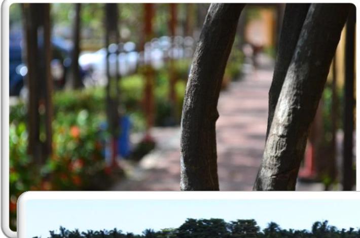
PASILLO DE LA BIBLIOTECA PILOTO DEL CARIBE LA ADUANA ESCENARIO DOCUMENTAL