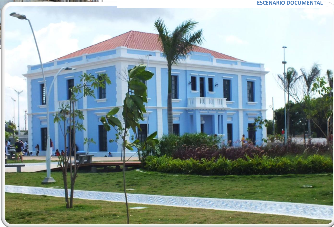
INTENDENCIA FLUVIAL RESTAURADA ESCENARIO DOCUMENTAL