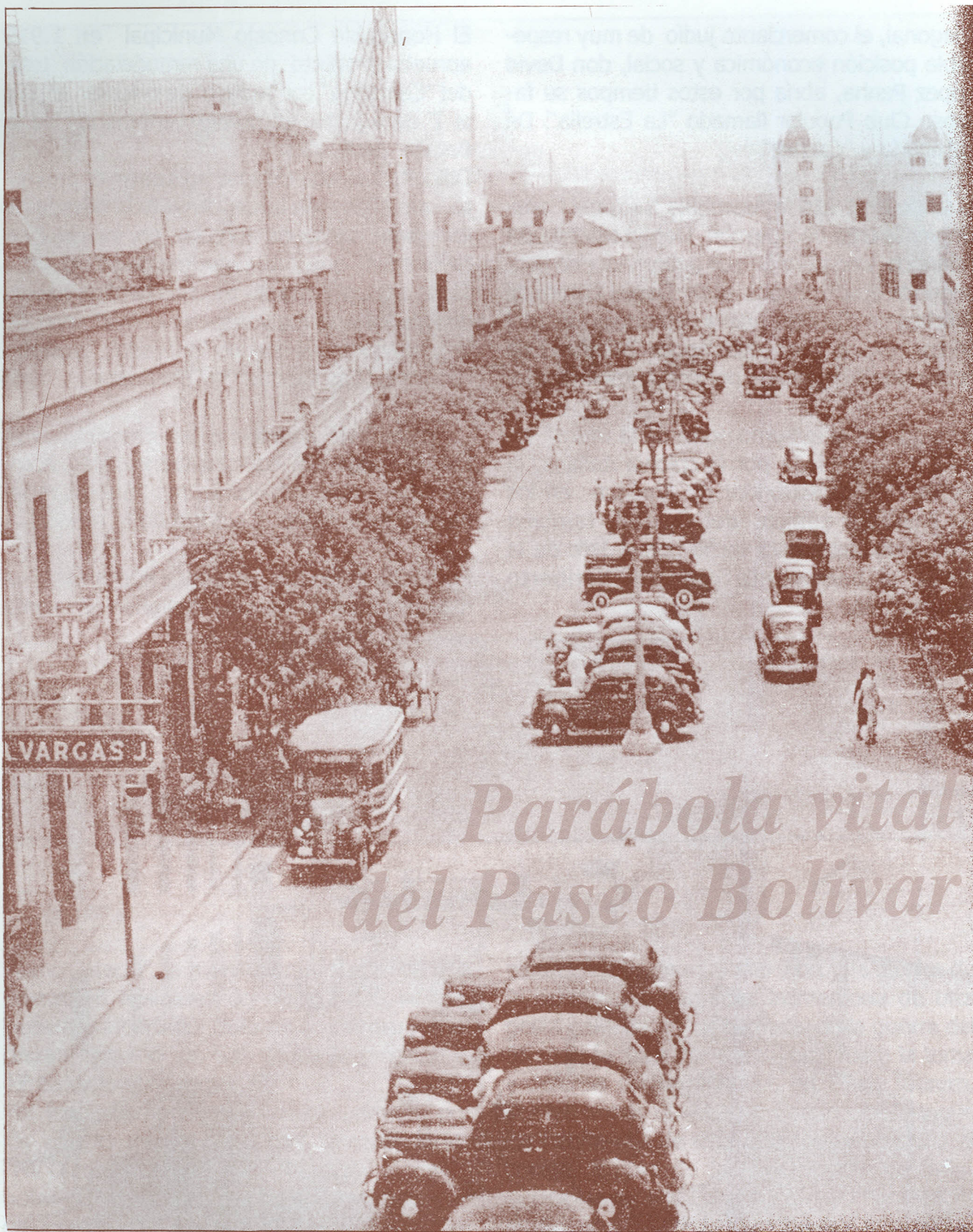
Paseo de Bolívar --1938--