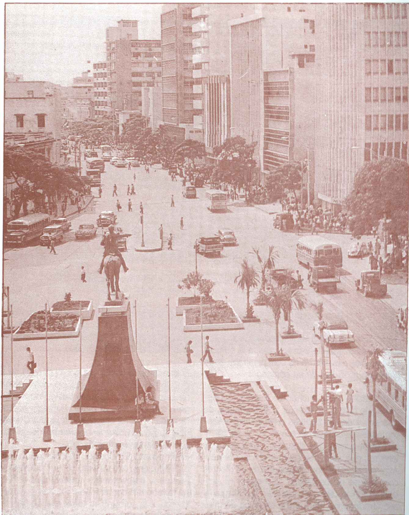
Paseo de Bolívar 1970