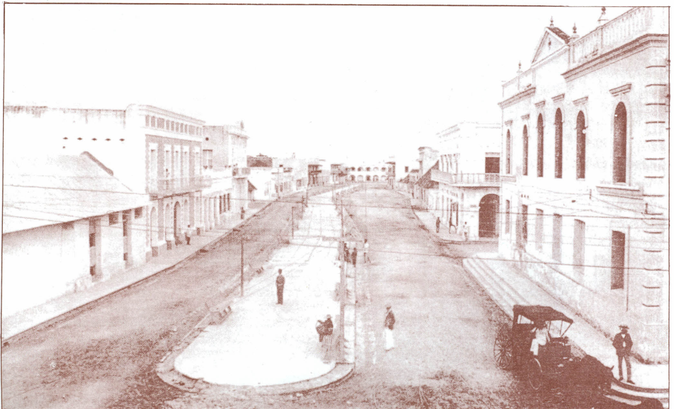
Camellón Abello --1900--

En 1.930, la ciudad para esta época exige ya más amplitud de sus vías, teniendo en cuenta