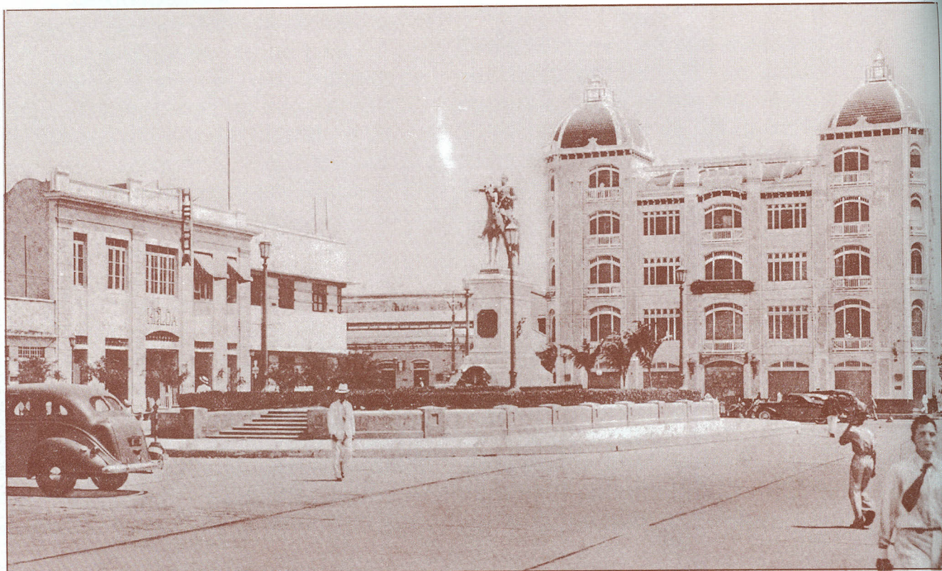
Estatua ecuestre del Libertador, al fondo, el Edificio Palma. --1937--

La arborización perdió su encanto por negligencia en su mantenimiento; y el desorden del tráfico automotor acabó por causar infarto al corazón vial de Barranquilla, a la reliquia más cordial, a través de la cual palpitaba todo dinámico proceder de su comercio.