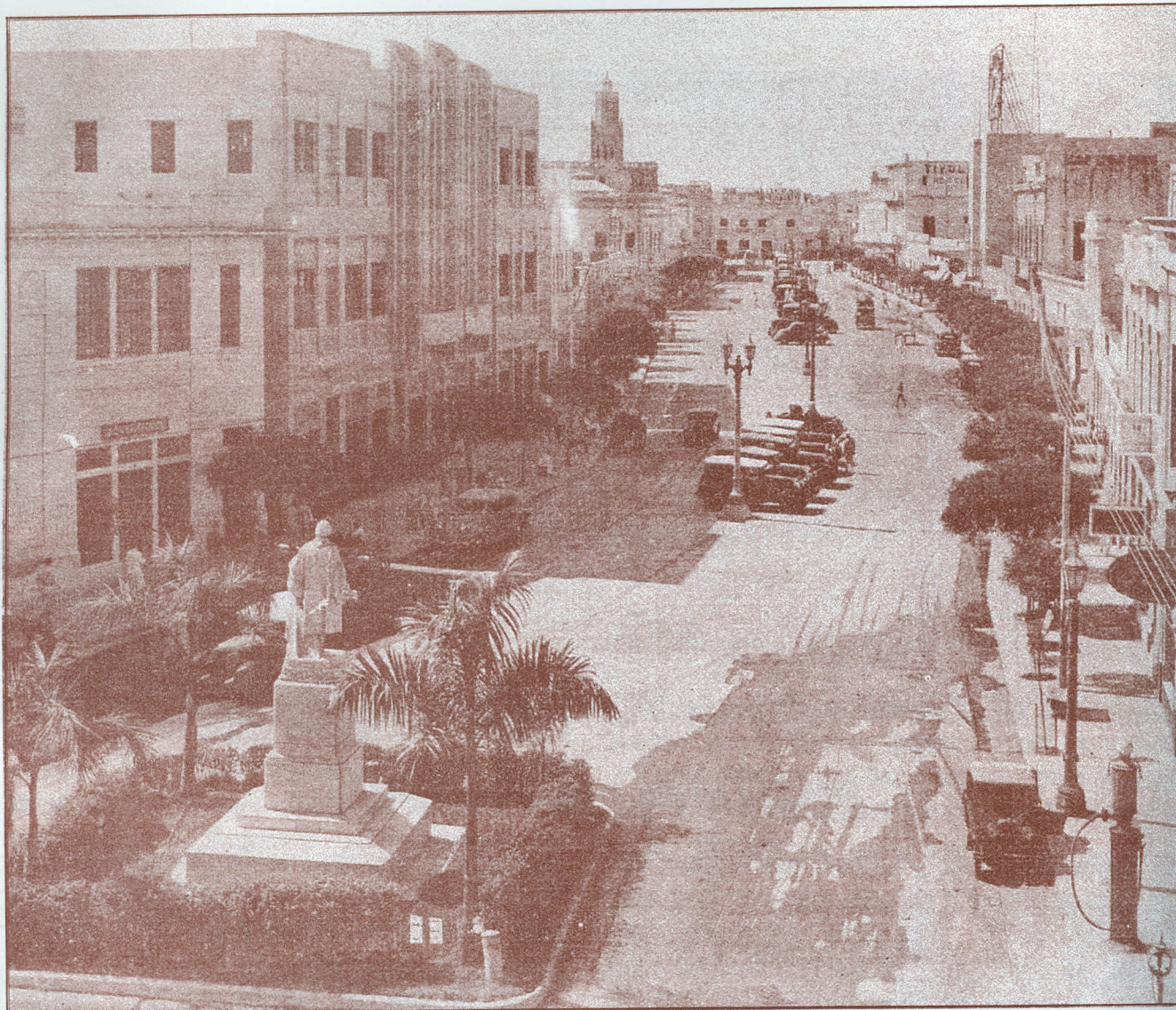
Paseo de Colón --1930--

"Pacho Palacio", la mansión que fuera de don Bartolomé Molinares, donde en 1.830, se hospedara el Libertador durante su penosa jornada que terminó en San Pedro Alejandrino el 17 de diciembre de 1.830.