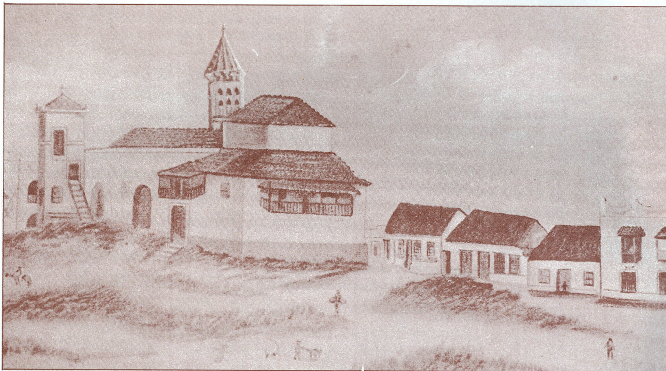
Primitiva Iglesia de San Nicolás --1885--

El "Camellón Abello", así pintorescamente conocido, dio imagen consecuente con la ciudad que supo gozar este lugar suficientemente hasta el punto que, concertaciones de toda índole: tertulias, retretas, procesiones; plebiscitos políticos; "Batallas de flores"; verbenas y demás regocijos populares se llevaban a efecto en este solaz, considerado, cual decían los afrancesados de entonces en el "Rendez-vous" de "La Arenosa".