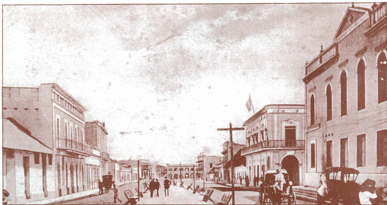
Camellón Abello --1910--

En 1.928 fueron colocados los “Faros” para regular el tráfico en la ciudad, el primero de los cuales se ubicó en el cruce de la calle España con la Arteria del Paseo Colón y calle-