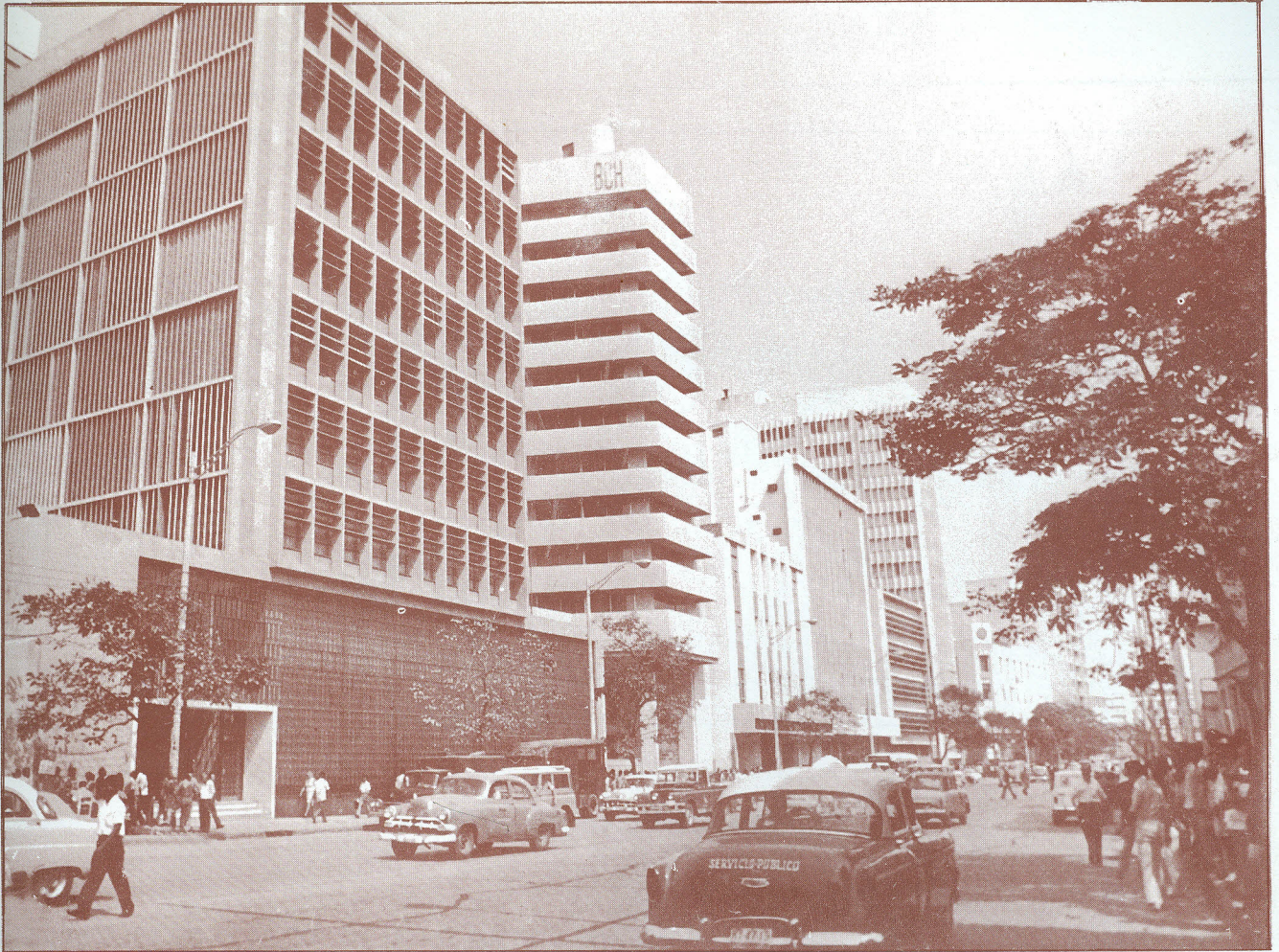
Zona bancaria del Paseo Bolívar --1960--