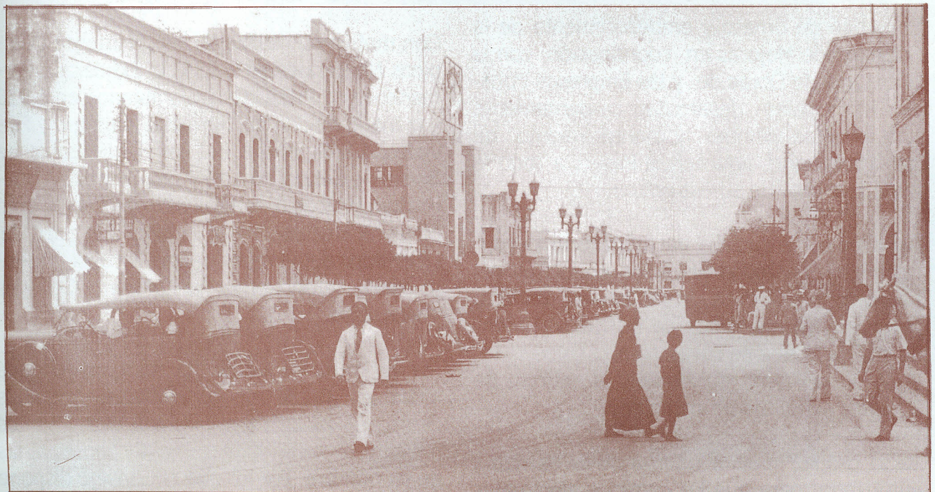
Paseo de Colón --1933--