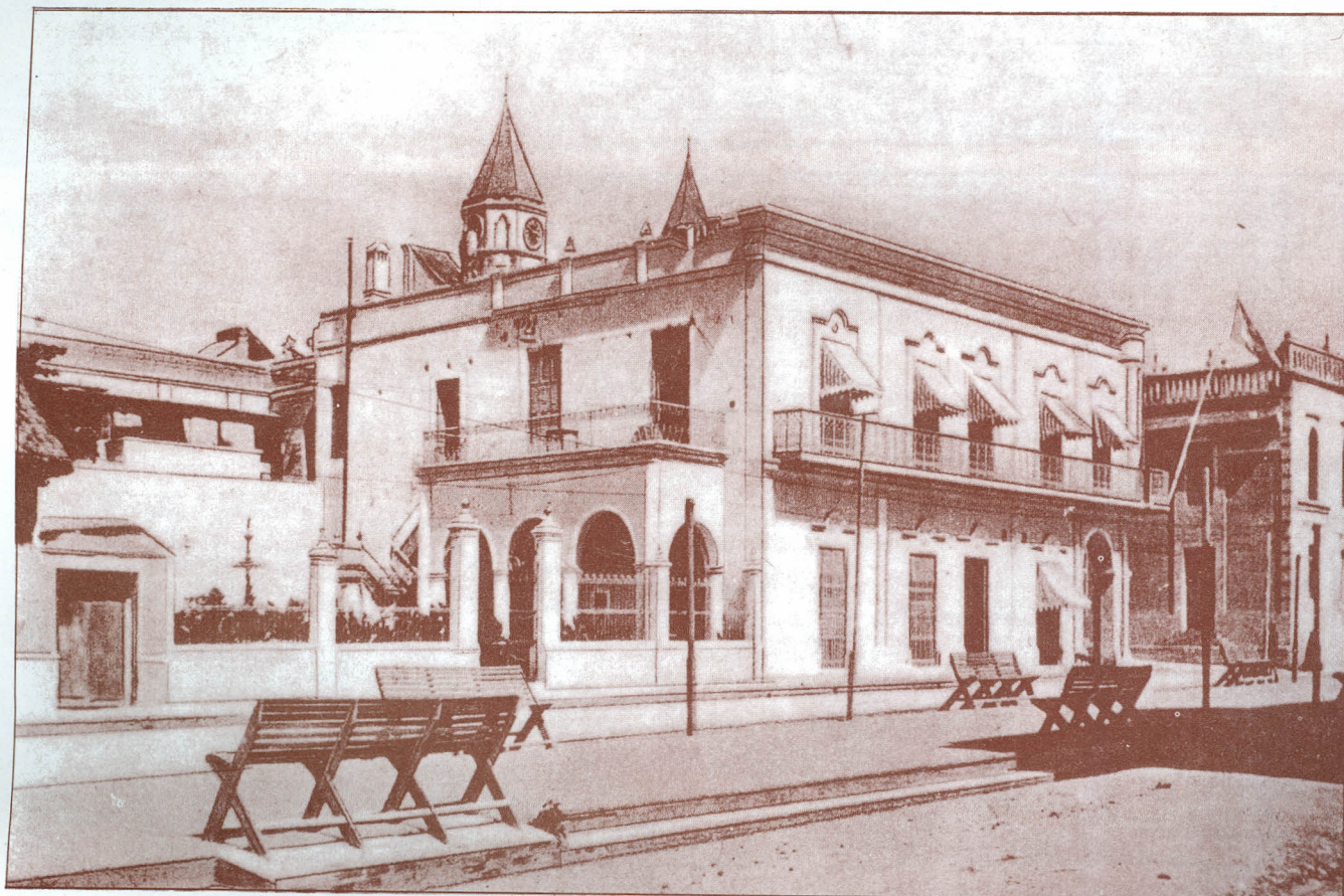
Club Barranquilla --1907--

En 1.936 en Consejo Municipal aprueba el Acuerdo por medio del cual se autoriza la