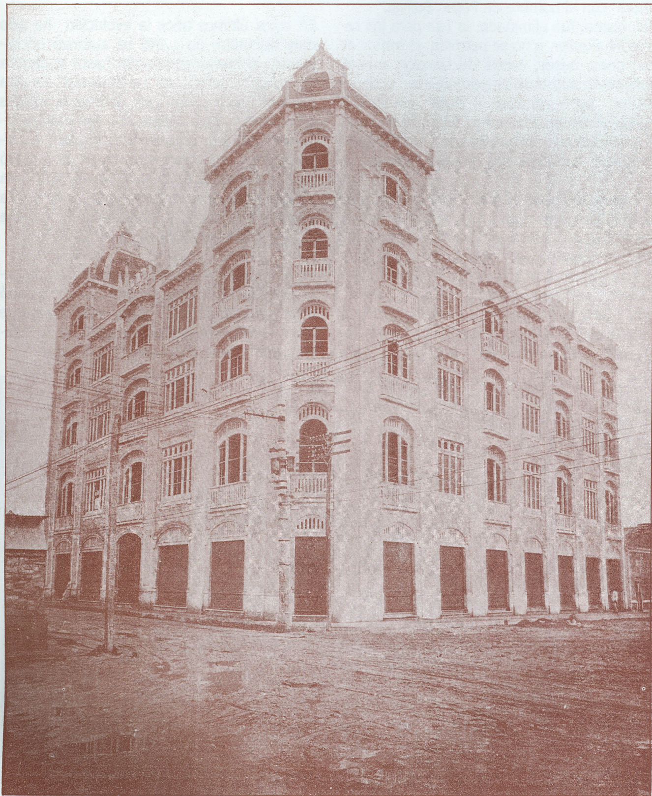
Edificio Palma --1926--