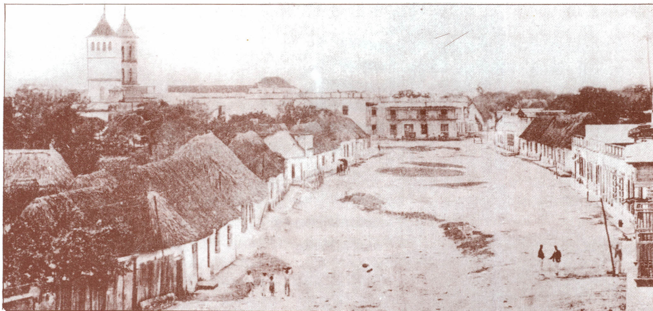
Primitiva Calle Ancha --1880--